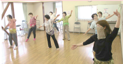
↑アラビアンダンスの様子(公郷老人憩いの家)

日時 7/10・17・24・31(全4回) 土 10:30~12:00 教材費 770円(口を覆う布)