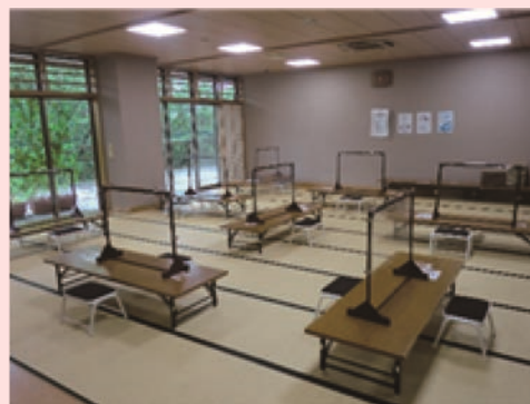
飛沫防止パーテーションを間に立てた囲碁将棋対局

また、職員が巡回消毒を行っております。 (ヘルストロン、マッサージ機、ソファ、階段手摺、トイレの便器、ドアノブ、手洗い場)